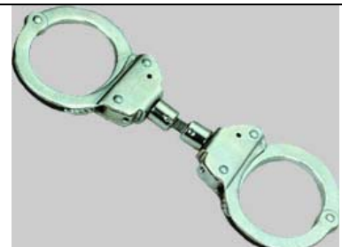
Handschelle Cuff mit Gelenk Art.-Nr.: 4410