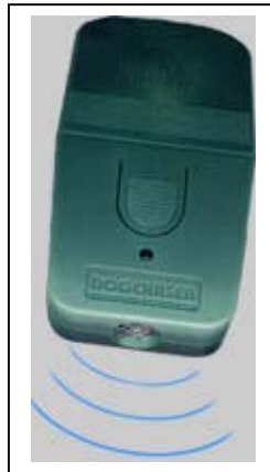
Dog-Chaser Ullraschall Hundeabwehr Art.-Nr.: 07000

Mit dem Dog-Chaser schützen Sie sich zuverlässig vor aggressiven Hunden und anderen Tieren. Dank seines geringen Gewichtes eignet der Dog-Chaser sich insbesondere für Wanderer, Jogger und Radfahrer. Hundebesitzer , die ihren eigenen Hund vor den Angriffen fremder Hunde schützen müssen, oder ihn einer Hunde-Dressur unterziehen, finden in dem Dog-Chaser ein hilfreiches und nützliches Instrument. Auf Tastendruck sendet der Dog-Chaser bis auf 5 Meter ein Hochfrequenz-Intervall aus. 20.000 - 25.000 Hz sind für den Mensch nicht hörbar, für einen Hund jedoch sehr abschreckend. Mit dem Dog-Chaser stoppen Sie angreifende Hunde, ohne sie zu verletzen.