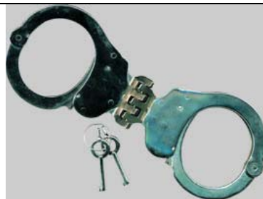
Handschelle Cuff mit Breitscharnier Art.-Nr.: 4420