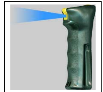
Super-Garant Art.-Nr.: 00802