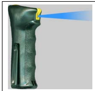
Pepper-Pro Art.Nr.: 00741