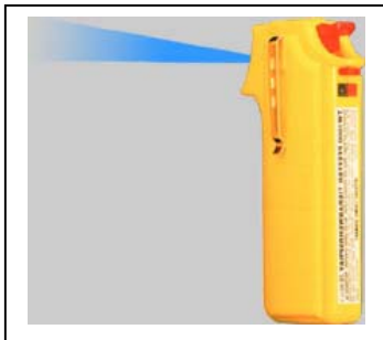
Pfeffer-Jet Art.-Nr.: 000740

00733 BP, 25 ml 00723 Man, 40 ml 00730 Standard, 63 ml 00743 Super, 75 ml 00753 Gigant, 150ml 00763 Super-Gigant, 400 ml