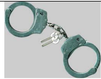
Handschelle Strong vernickelt Art.-Nr.: 4520