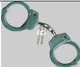
Handschelle Standard Edelstahl Art.-Nr.: 4520