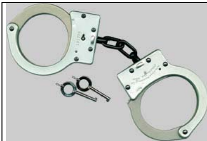
Handschelle Smith & Wessen Mod. 100 Art.-Nr.: 4600

Schlüsselanhänger mit CS-Reisgas 15 ml Panzerkette mit Schlüsselring der durch eine Feder gesichert ist. Farblich Sortiert Art.-Nr.: KG