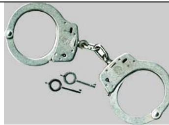
Handschelle A105 Ultralite (Alu) Art.-Nr.: 4700